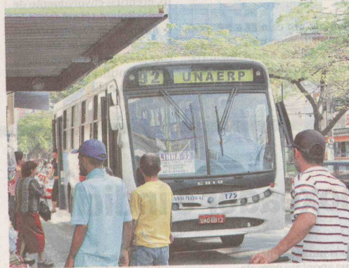
Sindicato convocou duas assembleias hoje para definir sobre a greve