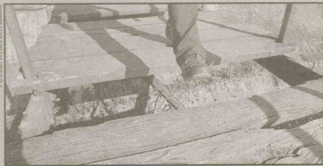
Av. Mário Daige (Esplanada do Castelo) Pontilhão de madeira com piso deteriorado. Faltam duas tábuas. No meio da ponte existe um vão de aproximadamente 70 centímetros, suficiente para a queda de uma criança. Há madeiras podres e soltas.