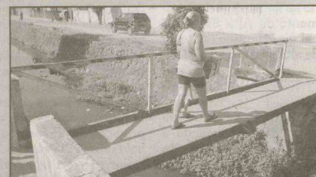
Av. Luiz Gama (Pae Cará) Ponte em péssimo estado. Tem apenas 1 metro de largura e não oferece proteção aos pedestres.