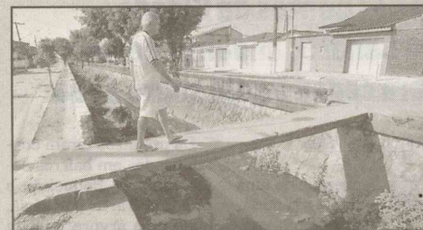
Av. Luiz Gama (Pae Cará) Pontilhão de concreto sem proteção. Qualquer descuido pode significar uma queda de 3 metros de altura dentro do canal.