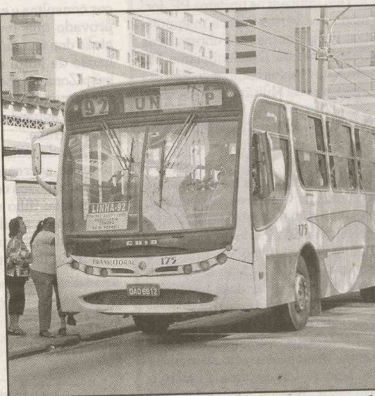
Com a greve, os veículos não estarão nas ruas de Guarujá amanhã

Também por meio de sua assessoria, a Prefeitura de Guarujá informou que não vai admitir que a falta de negociação prejudique a população. "Até porque a empresa tem obrigação legal de garantir uma frota mínima para atender as pessoas nas ruas". Se necessário, a Prefeitura promete agir no rigor da lei e uma comissão se reúne na segunda-feira, às 15h, para discutir o tema e buscar uma solução para o transporte público.