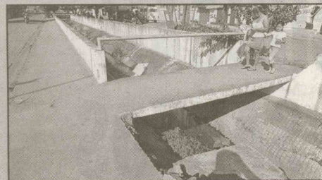
Av. Francisco de Castro (V. Áurea) O pontilhão não possui proteção em um dos lados. A mureta do canal está quebrada.