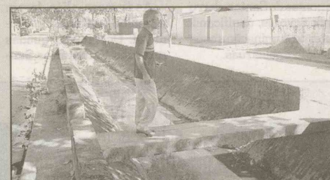
Av. Bento Pedro da Costa (J. Conceiçãozinha) Passagem de concreto sem guarda-corpo. Risco de queda.

equipes aos pontilhões citados. Será feito um levantamento das necessidades de cada ponte. De acordo com Prefeitura, em até 60 dias as passagens receberão serviços de manutenção ou serão substituídas.