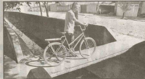
Av. Severo Conde (V. Áurea) Pontilhão estreito, com 80 cm de largura, sem qualquer tipo de proteção. Nesta avenida, há outras duas pontes na mesma situação.