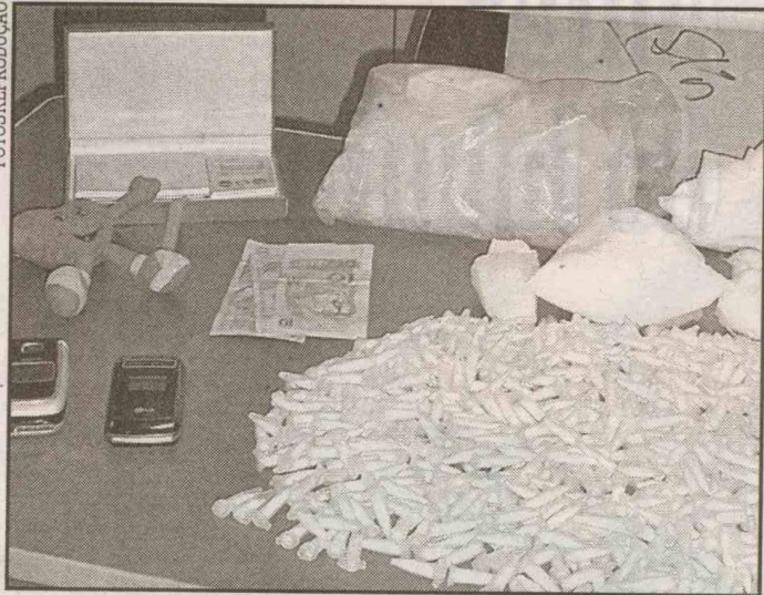
A cocaína estava a granel e acondicionada dentro de 780 cápsulas