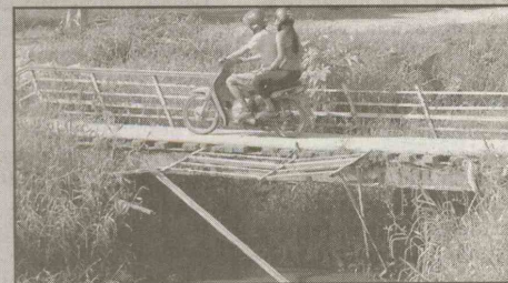
Av. Atlântica (Pae Cará) Em péssimo estado. Corrimão está caindo. No outro lado já não há mais proteção para quem se arrisca a passar pela ponte.