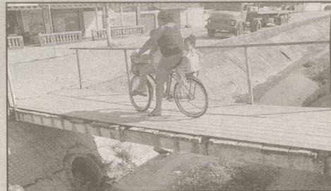
Av. Mário Daige (Esplanada do Castelo) O pontilhão está sem o guarda-corpo em um dos lados e possui tábuas soltas.